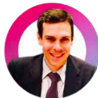
ALEXIS LABEL CEO